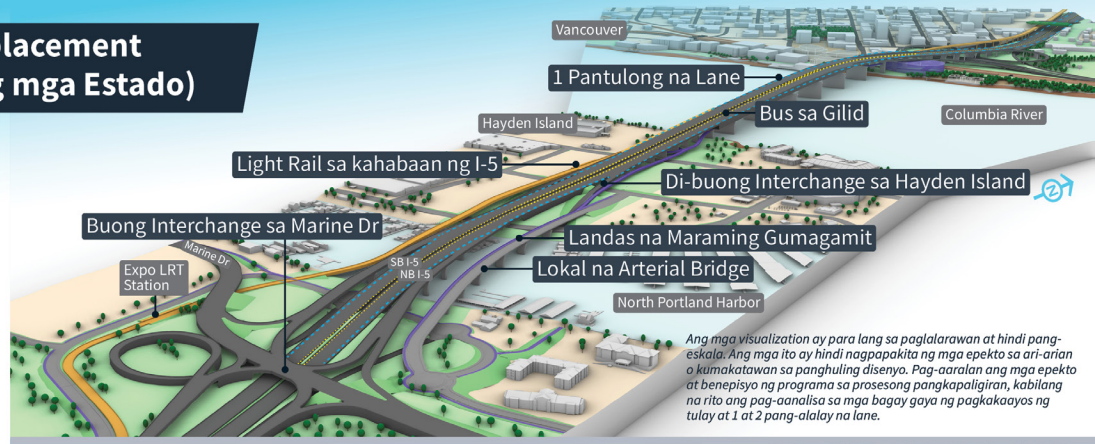
Ang mga visualization ay para lang sa paglalarawan at hindi pang-eskala. Ang mga ito ay hindi nagpapakita ng mga epekto sa ari-arian o kumakatawan sa panghuling disenyo. Pag-aaralan ang mga epekto at benepisyo ng programa sa prosesong pangkapoligiran, kabilang na rito ang pag-aanalisa sa mga bagay gaya ng pagkakaayos ng tulay at 1 at 2 pang-alalay na lane.